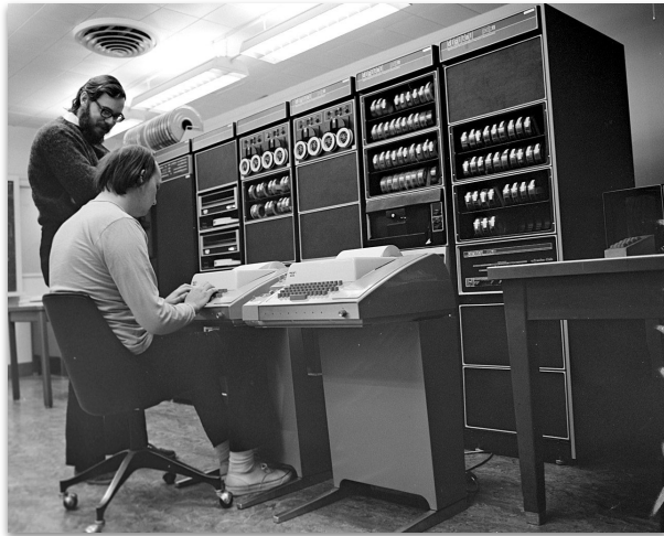
Dennis Ritchie و Ken Thompson